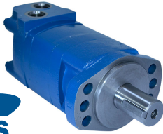
Motor Tipo Roller-Star Genuine Metaris Serie MMS Flecha Recta de 1 1/4" con Cuñero de 7.96 mm Montaje Magneto (6 Tornillos)