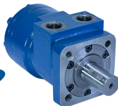
Motor Tipo Roller-Star Genuine Metaris Serie MMPS Flecha Recta de 1" con Cuñero de 1/4" Montaje SAE A (4 Tornillos)