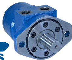
Motor Tipo Roller-Star Genuine Metaris Serie MMPS Flecha Recta de 1" con Cuñero de 1/4" Montaje SAE A (2 Tornillos)