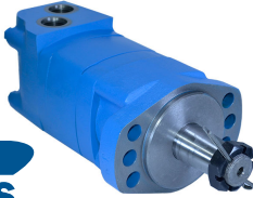
Motor Tipo Roller-Star Genuine Metaris Serie MMS Flecha Cónica de 1 1/4" con Cuñero de 7.96 mm Montaje Magneto (6 Tornillos)